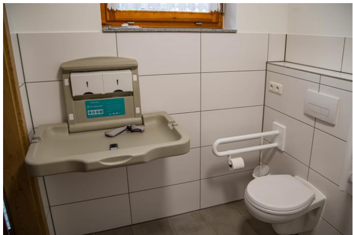
Behinderten- toilette und Wickeltisch im Pfarrsaal

Noch im Gange sind die Arbeiten am Sakristeiflur, wo die alten Glasbausteine aufgrund ihrer ungünstigen Dämmwirkung durch eine gut isolierte Mauer und Fenster ersetzt werden. Im Zuge dieser Maßnahmen wird auch die Außentreppe samt Geländer erneuert