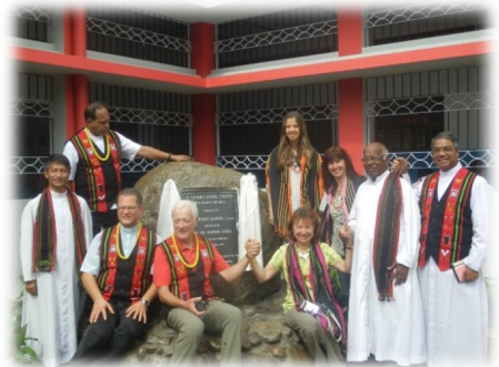
Schuleinweihung Peducha 2014

Das Dorf Peducha gehört zum Einzugsbereich der Salesianer Pfarrei Sechu-Zubza. In der Gemeinde leben rund 1000 Menschen. Die Mehrheit der Bevölkerung gehört zum Volk der Angami (Untergruppe der Naga).