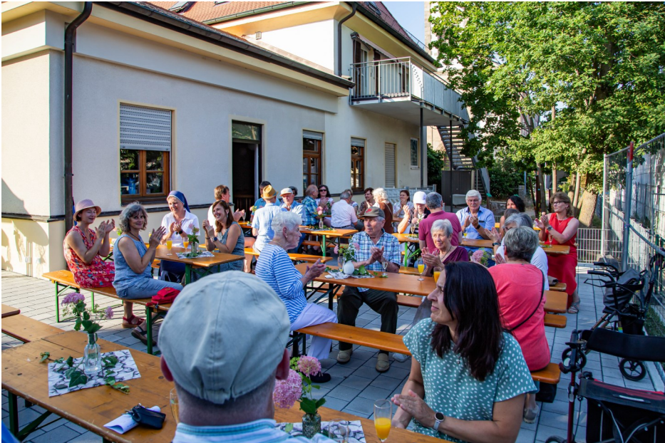
Beim Ehrenamtsabend am 08. Juli wurde die neue Terrasse am Pfarrsaal eingeweiht.