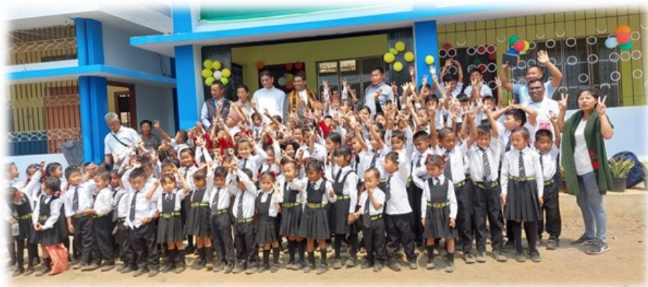
Einweihung des Schulanbaus in Peducha am 15. April 2023

Über sieben Jahre haben wir für diese Schulhauserweiterung Geld gesammelt. Mit 70.000 Euro unterstützten wir durch zahlreiche Aktionen und einige großzügige Spenden dieses Projekt. Fast 6000 Euro betrug der Eigenanteil von Don Bosco Nagaland.