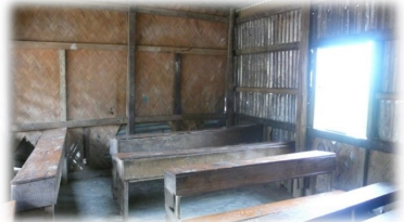
Bastmatten an den Wänden