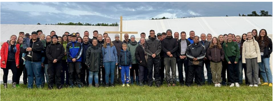
Helferteam des 25. Zeltlagers