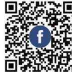
Facebook Pfarrrei St. Josef Weisendorf