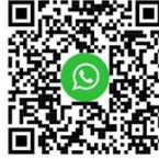
Whatsapp Channel St. Josef Weisendorf