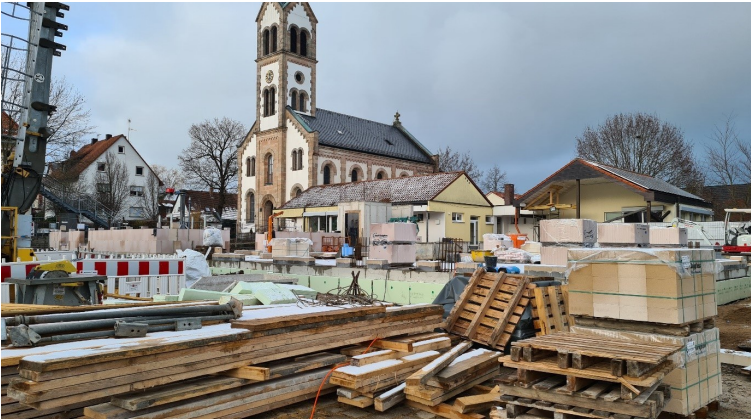
Baustelle Anbau Kinderhaus St Josef im Januar 2023