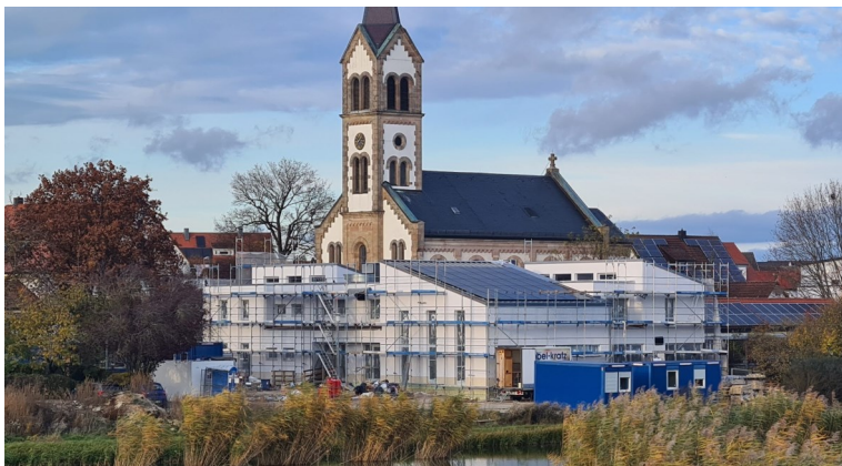
Anbau Kinderhaus St Josef im Novem- ber 2023